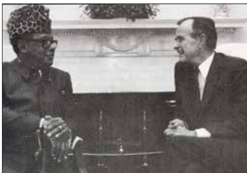
موبوتو و جرج واکر بوش چهارمین رئیس جمهور ایالات متحده