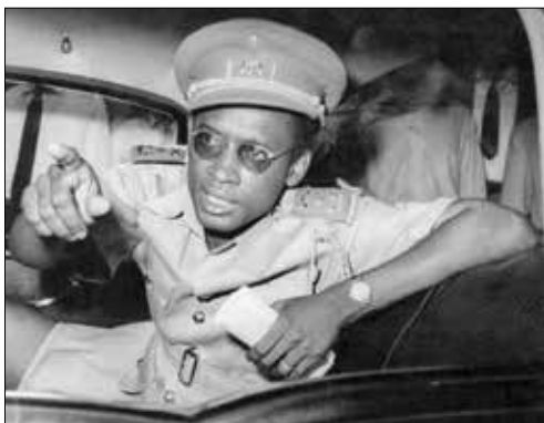
موبوتو در زمان استقلال کنگو

با سازمان ملل، بریتانیا و بلژیک، به موبوتو رئیس کودتای ارتش در دستگیری، شکنجه و اعدام لومومبا در ۱۷ ژانویه ۱۹۶۱ کمک کرد. یکی از رؤسای جمهور ایالات متحده یک بار در مورد دیکتاتور نیکارگوئه، «آناستازو سومورا» گفت: «سومورا ممکن است یک عوضی باشد، اما او پسر عوضی ما است.» ایالات متحده در موبوتو، سوموزای آفریقایی خود را پیدا کرد و از سال ۱۹۶۵ تا پایان جنگ سرد در سال ۱۹۹۱ به حمایت از او ادامه داد. مخالفان او شکنجه شده یا خرید می شدند؛ وزرای او کل بودجه را زدیدند و در نهایت دولت از بین رفت! غرب به رژیم موبوتو اجازه داد تا میلیاردها دلار وام بگیرد که همگی به سرقت رفت؛ اما حمایت نظامی و کمک مالی برای حفظ او در قدرت در حالی که دولتش در حال غارت بود، فراهم می شد. موبوتو بیش از ۴ میلیارد دلار دزدید! برای خود یک ورسای ساخت و ۳۳ ملک از جمله ویلا لوكس در منطقه اعیان نشین ریویرای فرانسه در نزدیکی قلعه لئوپولد دوم به دست آورد؛ اما اقتصاد کنگو ۶۰ درصد کوچک شد، تورم به ۲۳۰۰ درصد رسید و استانداردهای زندگی حتی به سطح قبل از استقلال کاهش یافت!