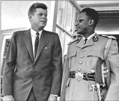
موبوتو و جان اف کندی سی و پنجمین رئیس جمهور ایالات متحده