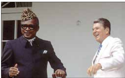
موبوتو و رونالد ریگان چهارمین رئیس جمهور ایالات متحده