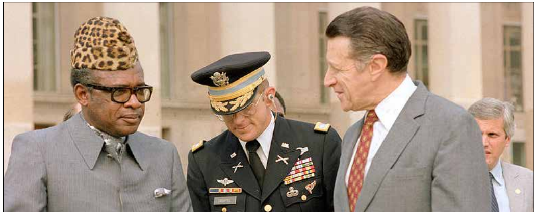
بازدید موبوتو از پنتاگون