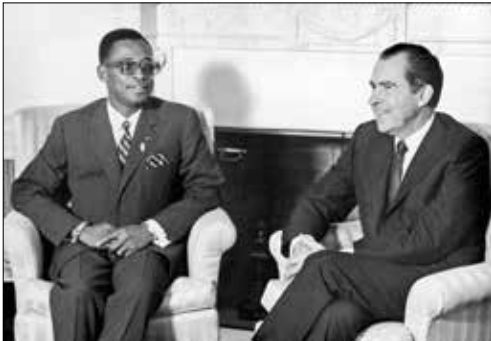
موبوتو ریچارد نیکسون سی و هفتمین رئیس جمهور ایالات متحده