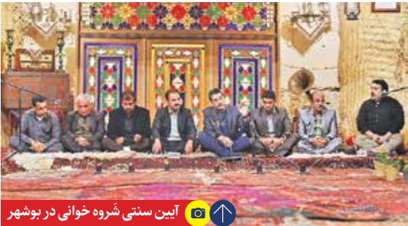
آیین سنتی شروره خوانی در بوشهر