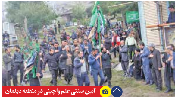
آیین سنتی علم واچینی در منطقه دیلمان

خراسان است، او در توضیح این مقام گفت: «زمانی که دشمن به منطقه درگز حمله می‌کند کردهای غیور کرمانج که حدود ۴۰ نفر بوده‌اند برای دفاع از منطقه خودشان با آنها درگیر و هر ۴۰ نفر کشته می‌شوند و مردم آن مناطق برای موسیقی سوگ اجرا می‌شود که سر سرمن‌های این افراد مرثیه‌خوانی می‌کنند. مرحوم استاد حاج قربان ایرانی است، براین اساس در بخش موسیقی آیینی با آیین‌های مختلفی سروکار داریم که همچنان مرسوم است. مانند آیین ولادت، سنور، سوگ و... که هر کدام از این آیین‌ها به لحاظ موسیقایی تعریف خاصی دارند. اما در خصوص آیین سوگ در منطقه خراسان باید بگویم این آیین بخشی از موسیقی اقوام ایران است که از گذشته به نسل‌های بعد منتقل شده و شامل مرثیه‌هایی است که در خصوص شخصیت‌های بزرگ اسلام سروده شده و نسل به نسل انتقال پیدا کرده است. به‌طور مثال در منطقه شرق خراسان مانند کاشمر مرثیه «ممدحسین» اجرا می‌شود که روایت‌های مختلفی در خصوص این مرثیه است و البته در مناطق دیگر خراسان هم خوانده می‌شود اما آنچه از لحن و لهجه این مرثیه شنیده می‌شود مربوط به آن منطقه خراسان است. روایت این مرثیه بدین صورت است که در دوران سید محمدحسین بر اثر اتفاقی که هم روایت عاشقانه بر آن صدق می‌کند و هم روایت ملی میهنی به شهادت می‌رسد. یعنی برای دفاع از میهن به شهادت رسیده و مادر محمد حسین برای فرزندش اشعاری می‌خواند