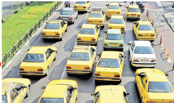
تاکسی: ترافیک است

اعضای شورای اسلامی شهر تهران بررسی نامه فرماندار تهران درباره اعتراض هیأت تطبیق به مصوبه «تعیین نرخ بلیت و کرایه وسایل حمل و نقل عمومی شهر تهران در سال ۱۴۰۲» را در دستور کار قرار دادند و تغییراتی در نرخ‌های تعیین شده اعمال شد. به گزارش ایرنا، سید جعفر تشکری هاشمی رئیس کمیسیون حمل و نقل و عمران شورای شهر در یکصد و سی و هشتمین جلسه شورای شهر تهران اظهار داشت: افزایش ۴۶ درصدی نرخ کرایه، کمتر از نرخ تورم بود.