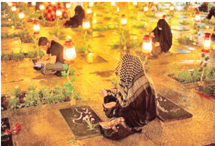
عکس ترنیتی است