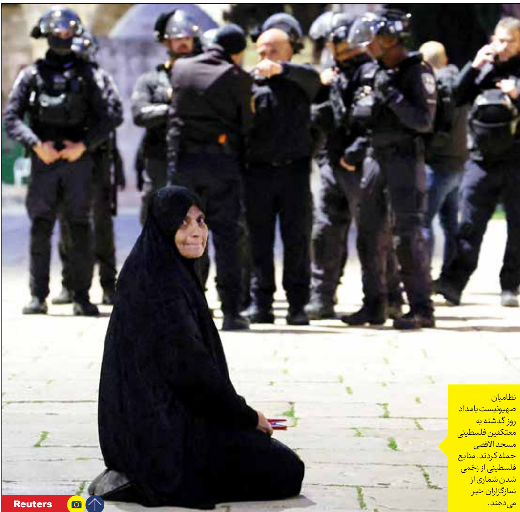
نظامیان صهیونیست با مامد روز گذشته به متکفین فلسطینی حمله کردند. منابع فلسطینی از زخمی شدن شماری از نمازگزاران خبر می دهند.

ارتش رژیم صهیونیستی با یورش به نمازگزاران فلسطینی ۵۰۰ نفر را با زداشت کرد پاسخ مقاومت به هتک حرمت مسجد الاقصی