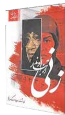
معصومه زورمند پژوهشگر

تمامی عکس‌های دوران حیاتش از جوانی تا پیری را که نگاه می‌کنیم، یک ویژگی مشترک مخاطب را جذب می‌کند و آن تصویر انسانی بی‌نهایت مهربان و توأم با یک صلابت خاص زنانه است. ۲۷ آبان ماه سال ۱۳۹۵ بود که خبر درگذشت او را اعلام کردند. فرقی نمی‌کند او را با اسم مرضیه دباغ، خواهر طاهره، خواهر زینت احمدی نیلی، مادر انقلاب یا مادر بزرگ انقلاب بشناسیم؛ چرا که همه افراد نزدیک به او، بر این نکته اذعان دارند که هیچگاه برای خود به دنبال اسامی و القاب نبود و چه بسا همین ویژگی او را با آنکه در متن وقایع انقلاب بود در حاشیه تاریخ امروز قرار داد.