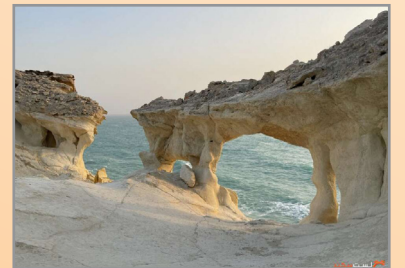
«تب» نگینی در غرب هرمزگان

گوشه گوشه سواحل خلیج فارس پر از مناطق جذابی است که هر گردشگری را شگفت‌زده می‌کند. در سواحل خلیج فارس پدیده‌های زیبایی بسیار زیادی وجود دارد که می‌تواند موجب آرامش و هیجان گردشگران شود. آب و هوای معتدل و آفتابی درخشان، چشم‌اندازهای بی‌نظیر، ترکیب دریا، دشت و کوه، همه با هم حس ناب و تازه را برای انسان به ارمغان می‌آورند که شاید مانند این حس را جایی تجربه نکرده باشید.