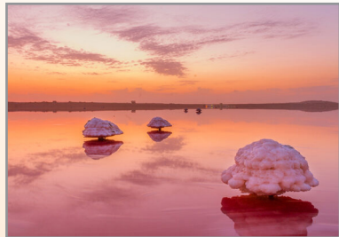
تالاب زیبای صورتی رنگ لیپار

به بیرون پرتاب می‌شود. جالب اینجاست که موقع پرتاب صدایی شبیه صدای شلیک فشنگ به گوش می‌رسد. چاهار سه گل فشان دارد، دو گل فشان تپه‌ای و یک گل فشان آتشفشانی. مردم محلی به این مکان ناف دریا هم می‌گویند.