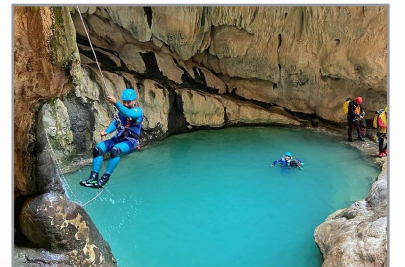
تنگ رغز، حوضچه‌ای مملو از ماهی در زیر آبشار

موضوع جذابیت این سواحل را بیشتر کرده است. اما جاذبه سواحل تب در کوشکنار به این خلاصه نمی‌شود. طبیعت در سالیان طولانی با دست‌انداختن هنرمندش میان دیواره‌های رسوبی تب اشکال شگفت‌انگیزی به وجود آورده است که در این میان یکی از آنها بیشتر خودنمایی می‌کند؛ جایی که به پنجره خلیج فارس معروف است. دریا از این بالا به قدری پاک و بکر است که می‌شود سنگ‌ها، مرجان‌های بی‌نظیر و حتی شنا کردن ماهی‌ها و لاک پشت‌ها را در آب دریا تماشا کرد.