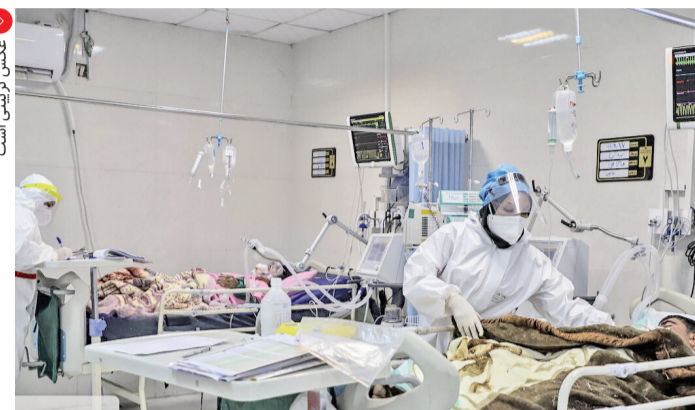
عکس ژوئینی است

باتوجه به آغاز تعطیلات و شروع دید و بازدیدهای نوروزی احتمال افزایش مجدد موارد کرونا در کشور وجود دارد