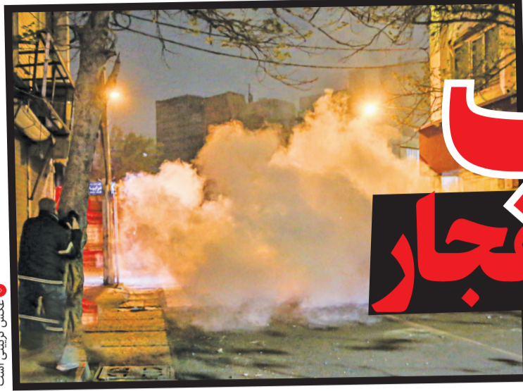
عکس تزیینی است

گروه حوادث/ چند سالی است که رسم سنتی و دیرین چهارشنبه سوری جای خود را به شبی پر از دلهره و ترس همراه با صداهای انفجار و وقوع حوادث خونین و مرگبار داده است.