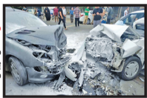
عکس تزیینی است

رئیس اورژانس تهران از وقوع یک فقره تصادف مرگبار در اسلامشهر و مرگ ۳ زن در صحنه تصادف خبر داد.