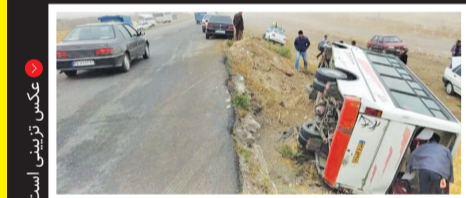
عکس تزیینی است

شامگاه پنجشنبه یک دستگاه مینی‌بوس کاروان عروسی در پیشوا واژگون شد و طی این حادثه ۳ نفر فوت و ۱۰ نفر مصدوم شده‌اند. به گزارش مهر، این مینی‌بوس در جاده شریف‌آباد ورامین واژگون شد.