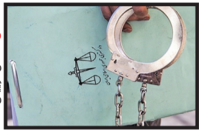
عکس تزیینی است

یکی از فعالان اینستاگرامی شهر ارومیه که در اتفاقات اخیر دنبال التهاب آفرینی بین مردم بود، توسط سرپازان گمنام امام زمان (عج) بازداشت شد.