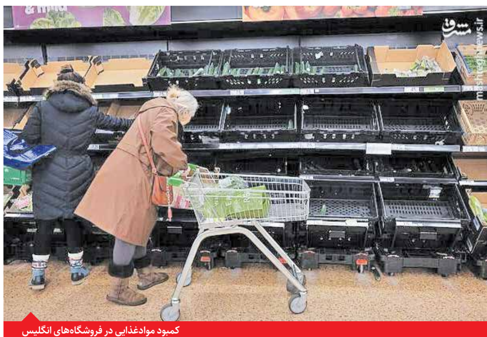
کمبود مواد غذایی در فروشگاه های انگلیس