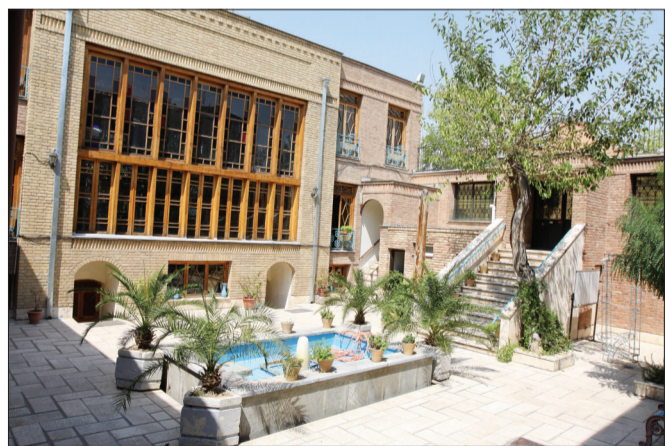
▲ عمارت بیگم سلطان