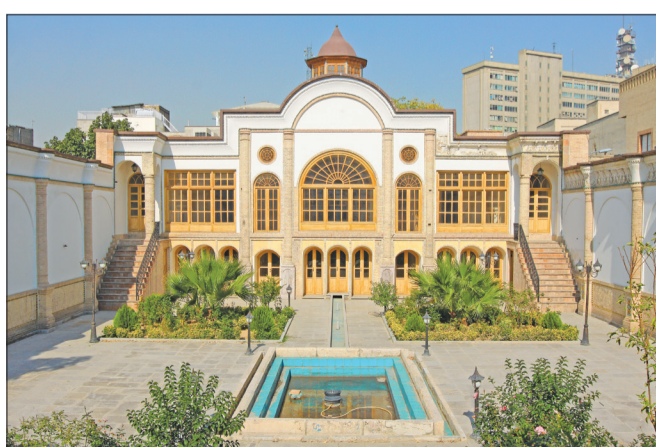
▲ عمارت ناصرالدین میرزا