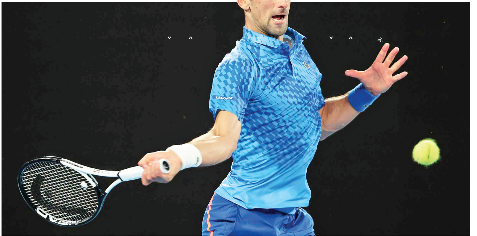
نگاهی به تنیس آزاد دویی