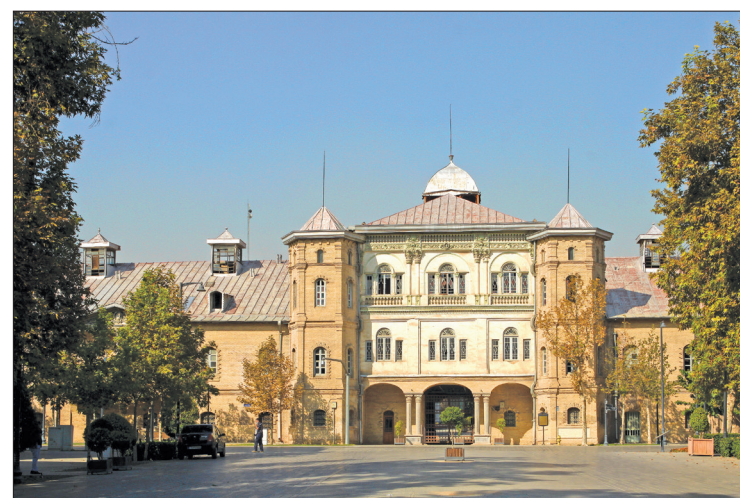
▲ عمارت کلاه فرنگی فرح آباد