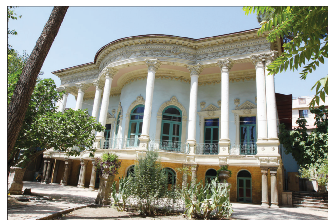
▲ عمارت مستوفی الممالک