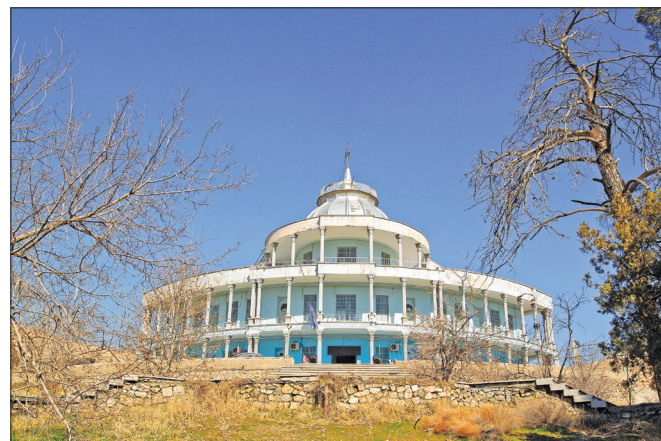
▼ عمارت قزاق خانه