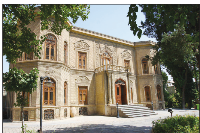
▲ عمارت قوام السلطنه