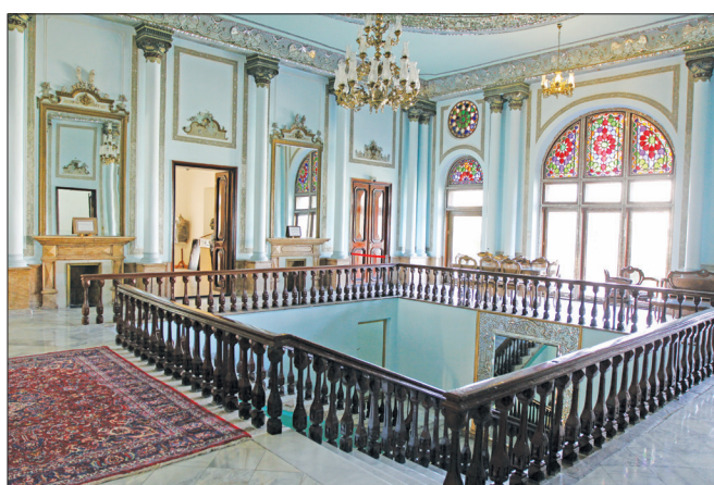
▲ عمارت تیمورتاش