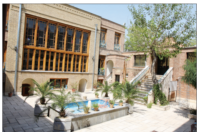
▲ عمارت بیگم سلطان