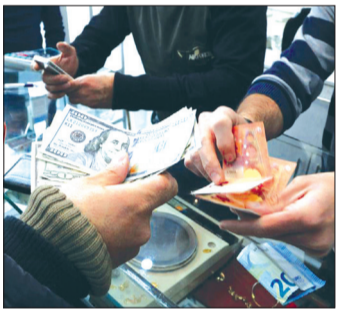
مدیرکل دفتر بازرسی و نظارت بر کالاهای اساسی وزارت جهاد کشاورزی: