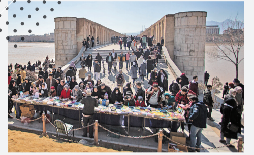
زنده رود پس از بارش‌های اخیر، آب به بستر خشک رودخانه رسیده و با جاری شدن آن این جاذبه توریستی جان دوباره‌ای گرفته است.