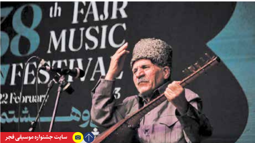
سایت جشنواره موسیقی فجر

ساخت ریویوت جدیدی از «پسر جهنمی» به کارگردانی برابان تیلور و مارک تولدین آغاز می‌شود. مایک مینیولا خالق کمیک پسر جهنمی، فیلمنامه این ریویوت را با کریس گلدن نوشته است. این فیلمنامه برگرفته از کمیک مرد جهنمی: مرد کج و کوله است که در ژوئیه سال ۲۰۰۸ برای نخستین بار عرضه شد. جفری گرینشتاین رئیس استودیو میلیونم مدیا در بیانیه‌ای گفته شد کج و کوله برداشتی از تمام فیلم‌های قبلی پسر جهنمی است که در آن مایک مینیولا و خالق کمیک‌ها در نهایت نسخه‌ای معتبر از داستان‌ها و شخصیت‌ها را در قالب فیلم ارائه خواهند کرد. او گفته برابان تیلور در تمامی زمینه‌ها متخصص است و من نمی‌توانم به شخص بهتری، به غیر از تیلور برای احیای داستان در نشان دادن این فیلم متفاوت و بدیع به مخاطبان بیاندیشم. ایرنا