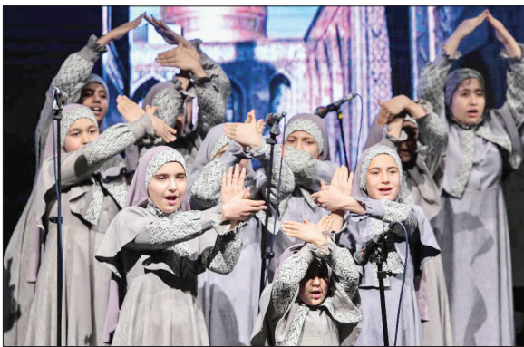
عکس: سایات جشنواره

داشت: ما در موسیقی اقوام ایران شاهد رنگارنگی و تنوع موسیقایی بسیاری هستیم و لازم است این موسیقی کهن بیشتر به مردم معرفی شود اما آنچه تحت عنوان موسیقی ایرانی و یا ردیف دستگاهی مطرح است و خوشبختانه در حال حاضر هم با عنوان موسیقی کلاسیک و