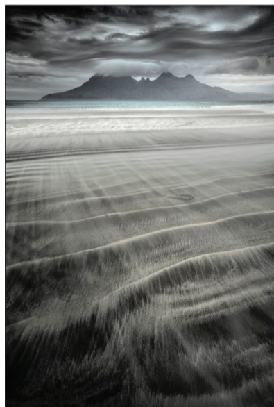
«دریای گمشده» اثر Julien Delaval