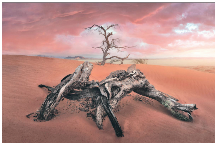
«درخت کهن» اثر Jose D. Riquelme