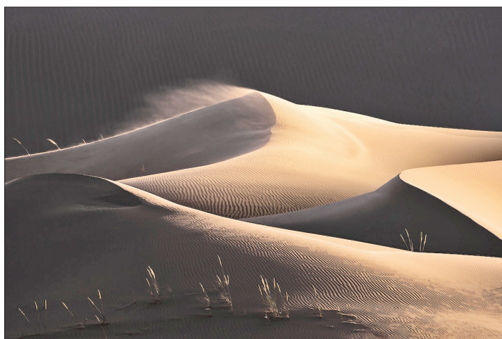
«زندگی تسلیم ناپذیر» اثر Tony Wang