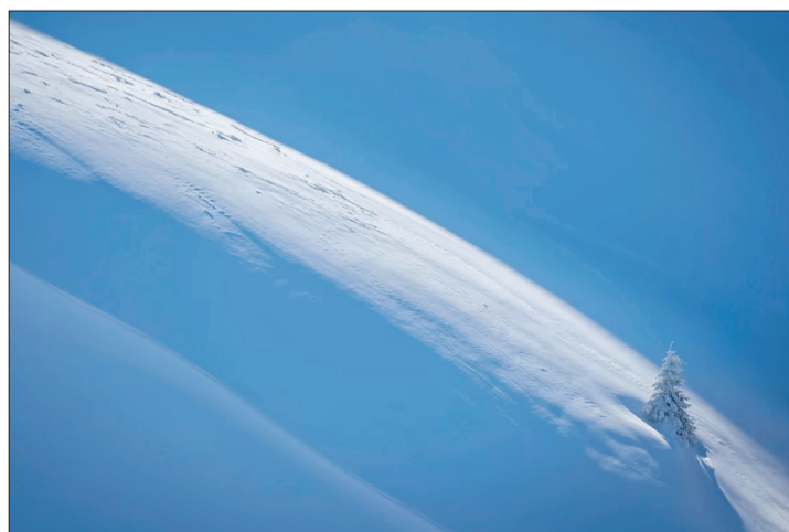
«جنگل‌های کوه‌های کارپات رومانی» اثر Daniel Marlea