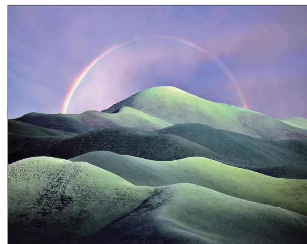
«زیر رنگین کمان» اثر Tony Wang

از دیرباز و پیش از پیدایش عکاسی، انسان علاقه بسیاری به ثبت تصویری از چشم‌اندازها با مناظر طبیعی داشته و این علاقه توسط نقاشی ثبت و به تاریخ سپرده شده است. پس از اختراع دوربین عکاسی در قرن نوزدهم این علاقه در بین مردم عمومیت پیدا کرد. به طوری که عکس‌های مناظر طبیعی به خانه‌ها، محل کار، رستوران‌ها، کافی‌شاپ‌ها، موزه‌ها و ... راه پیدا کرد.