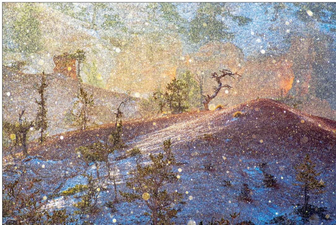
«مناظر صمیمی» اثر Eric Erlenbusch