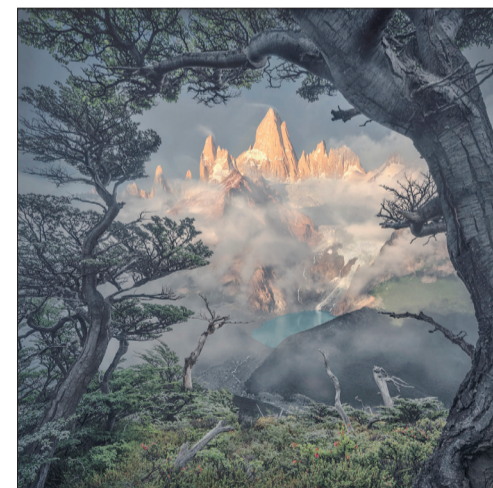
«زندگی تسلیم ناپذیر» اثر Max Rive