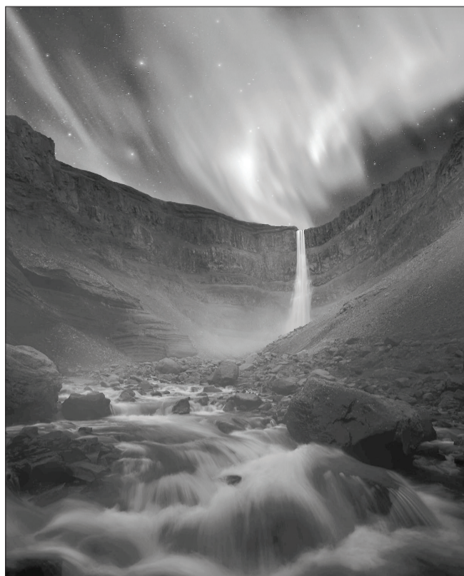
«پروژه درخشش سبز» اثر Daniel Laan