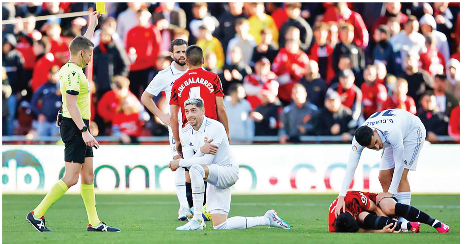
امیررضا همایون خبرنگار

رقابت‌های جام باشگاه‌های جهان که از چند روز گذشته به میزبانی مراکش آغاز شده است، امروز با برگزاری بازی نیمه نهایی وارد شرایط جدیدی می‌شود. طبق برنامه از پیش تعیین شده در این روز بازی اول مرحله نیمه نهایی مسابقات بین رئال مادرید قهرمان فصل گذشته لیگ قهرمانان اروپا و الاهلی مصر برگزار می‌شود، مسابقه‌ای که از اهمیت