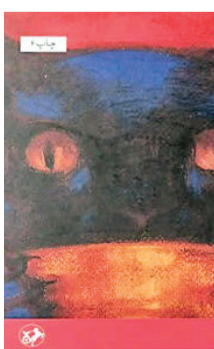
مرشد و مارگاریتا مخائیل بولگاکوف ترجمه بهمن فرزانه

رمان «مرشد و مارگاریتا» نوشته میخائیل بولگاکوف با ترجمه بهمن فرزانه به‌تازگی توسط انتشارات امیرکبیر به چاپ ششم رسیده است. این کتاب یکی از مشهورترین و مهم‌ترین آثار ادبیات روسیه محسوب می‌شود که ۲۵ سال پس از درگذشت نویسنده‌اش اجازه چاپ گرفت و منتشر شد و با گذشت یک شب از چاپ این کتاب، ۳۰۰ هزار نسخه از آن به فروش رفت.