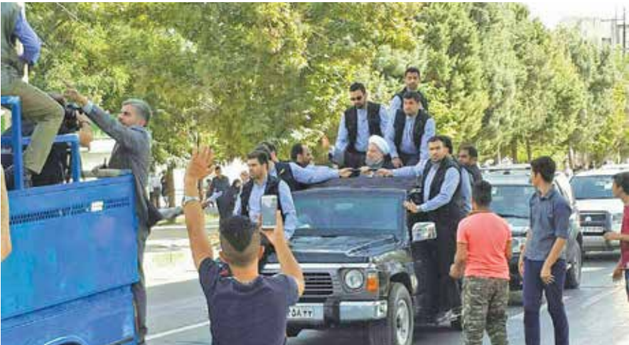
سفر استانی کرمانشاه

نظرسنجی مشترک دانش‌گاه مرینلد و مرکز افکار سنجی «ایران‌پل» (Iran Poll) در مهرماه ۱۴۰۰ نیز همین مسأله را با اندکی اختلاف نشان می‌دهد. این نظرسنجی که تنها چند هفته پس از تحلیف «آیت‌الله سیدابراهیم رئیسی» رئیس دولت سیزدهم ایران انجام شده بود، حمایت بی‌سابقه از رئیس جمهور جدید را نشان داد. پراساس این افکارسنجی ۷۸ درصد از پاسخ‌دهندگان گفتند