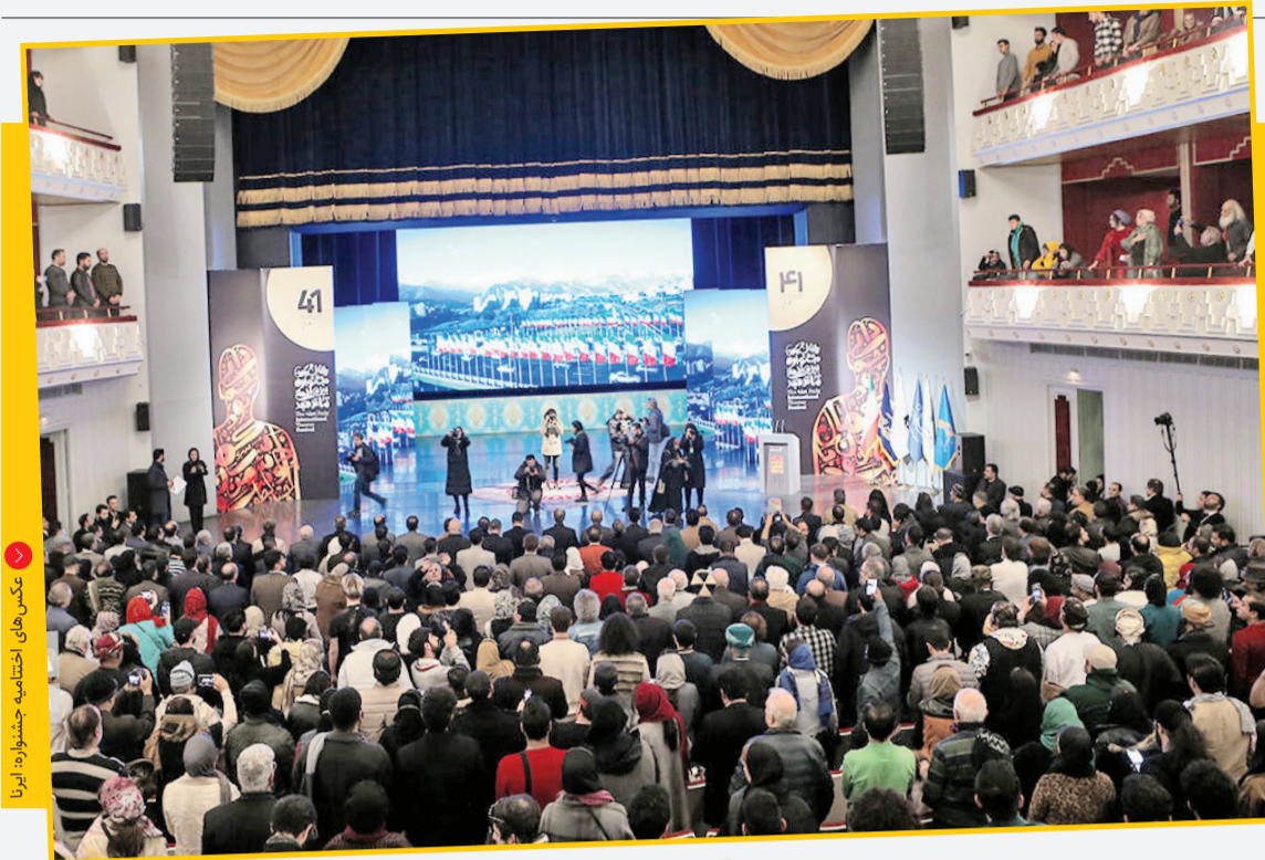
عکس‌های اختتامیه جشنواره