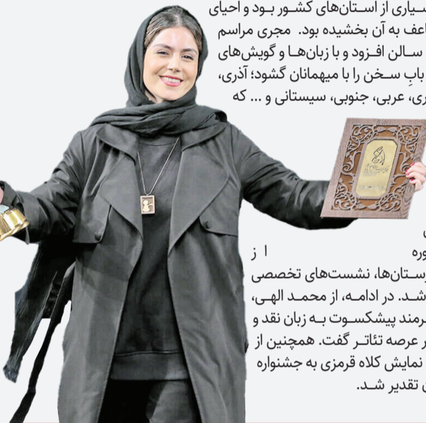
برگزیدگان بخش‌های مختلف رقابتی جشنواره تئاتر فجر

مراسم اختتامیه چهل و یکمین دوره جشنواره بین‌المللی تئاتر فجر عصر دیروز در تالار وحدت برگزار شد. به گزارش ایرنا، در این مراسم محمد مهدی اسماعیلی وزیر فرهنگ و ارشاد اسلامی با تقدیر از دست‌اندرکاران جشنواره و داوران ایرانی و خارجی و هنرمندان حاضر گفت: امسال بعد از چند سال، برگزاری جشنواره تئاتر منطقه‌ای را شاهد بودیم که حضور خیره‌کننده هنرمندان استان‌ها مایه تعجب و خوشحالی همه شد و برای همه ما روحیه‌بخش بود. طی این مراسم برگزیدگان ۱۱۳ اثر شرکت‌کننده در بخش‌های رادیوتئاتر، صحنه‌ای، خیابانی، بین‌الملل، نمایشنامه‌نویسی، پژوهش و مسابقه معرفی شدند و از آنان تقدیر شد. جشنواره چهل و یکم شاهد حضور گروه‌های بسیاری از استان‌های کشور بود و احیای جشنواره‌های منطقه‌ای، شوری مضاعف به آن بخشیده بود. مجری مراسم با اجرایی متفاوت بر شور و نشاط سالان افزود و با زبان‌ها و گویش‌های متنوع اقوام و مناطق مختلف ایران، با سخن را با میهمانان گوشه‌آذری، مازنی، گیلکی، ترکمن، کردی، بختیاری، عربی، جنوبی، سیستانی و ... که همزمانی آن با بخش موسیقی نواحی، با همراهی تماشاگران و گروه‌های نمایشی حاضر در سالن همراه بود. وی برای میهمانان خارجی نیز به زبان‌های انگلیسی و عربی خوش آمد گفت. در این مراسم، فیلمی از اجراهای این دوره جشنواره، تمرین‌ها و اجراهای شهرستان‌ها، نشست‌های تخصصی و دیگر بخش‌های جنبی پخش شد. در ادامه، از محمد الهی، کارگردان تئاتر، تقدیر شد و این هنرمند پیشکسوت به زبان نقد و البته محترمانه از اتفاق‌های تازه در عرصه تئاتر گفت. همچنین از محمدرضا مرتضوی، کارگردان، که با نمایش کلاه قرمزی به جشنواره آمده بود به‌عنوان استعداد جوان تقدیر شد.