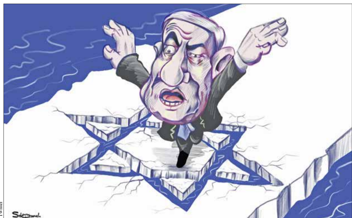
سیاست‌های کابینه افراطی بنیامین نتانیاهو باعث بی‌سابقه‌ترین شکاف‌ها در اسرائیل شد

ساکنان سرزمین‌های اشغالی طی یک دهه گذشته است. این درحالی است که نتایج همین نظرسنجی در سال ۲۰۱۲، حاکی از آن بود که ۷۶ درصد از ساکنان سرزمین‌های اشغالی، به آینده رژیم صهیونیستی خوش‌بین بوده‌اند. این پایگاه نظرسنجی، نتایج این تحقیق و داده‌های آماری آن را با استفاده از اطلاعات جمع‌آوری شده از ۲۰۰۳ تا ۲۰۲۲ تحلیل و اعلام کرده است، نتایج این تحقیق نشان می‌دهد، اعتماد اسرائیلی‌ها به هشت نهاد دولتی رژیم صهیونیستی به شدت کاهش یافته است. ارتش، پلیس، ریاست (جمهوری)، کابینه، کسوت، احزاب سیاسی و دادگاه عالی رژیم صهیونیستی، هشت نهادی هستند که اعتماد ساکنان سرزمین‌های اشغالی به آنها کاهش یافته است. نتایج این تحقیق همچنین نشان می‌دهد اعتماد اسرائیلی‌ها به دادگاه عالی تنها ۴۲ درصد، اعتماد آنها به کسوت ۱۸ درصد، به احزاب سیاسی تنها ۹ درصد و به رسانه‌ها نیز تنها ۲۳ درصد است و همچنین اکثریت قاطع ساکنان سرزمین‌های اشغالی معتقدند که چهره‌های سیاسی به منافع شخصی‌شان بیشتر از مردمی که آنها را انتخاب کردند، اهمیت می‌دهند.