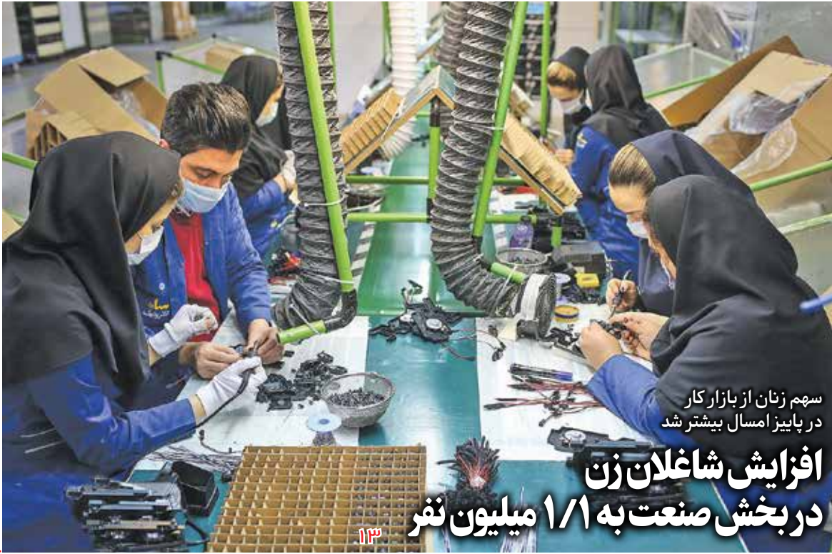
سهم زنان از بازار کار در پاییز امسال بیشتر شد