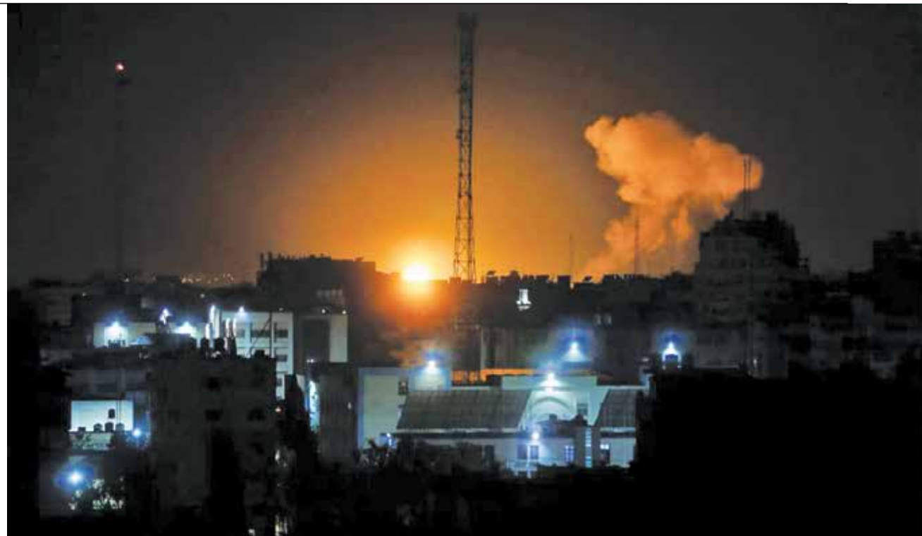
غزه برای دومین بار در ۷ ماه اخیر هدف حملات گسترده هوایی قرار گرفت