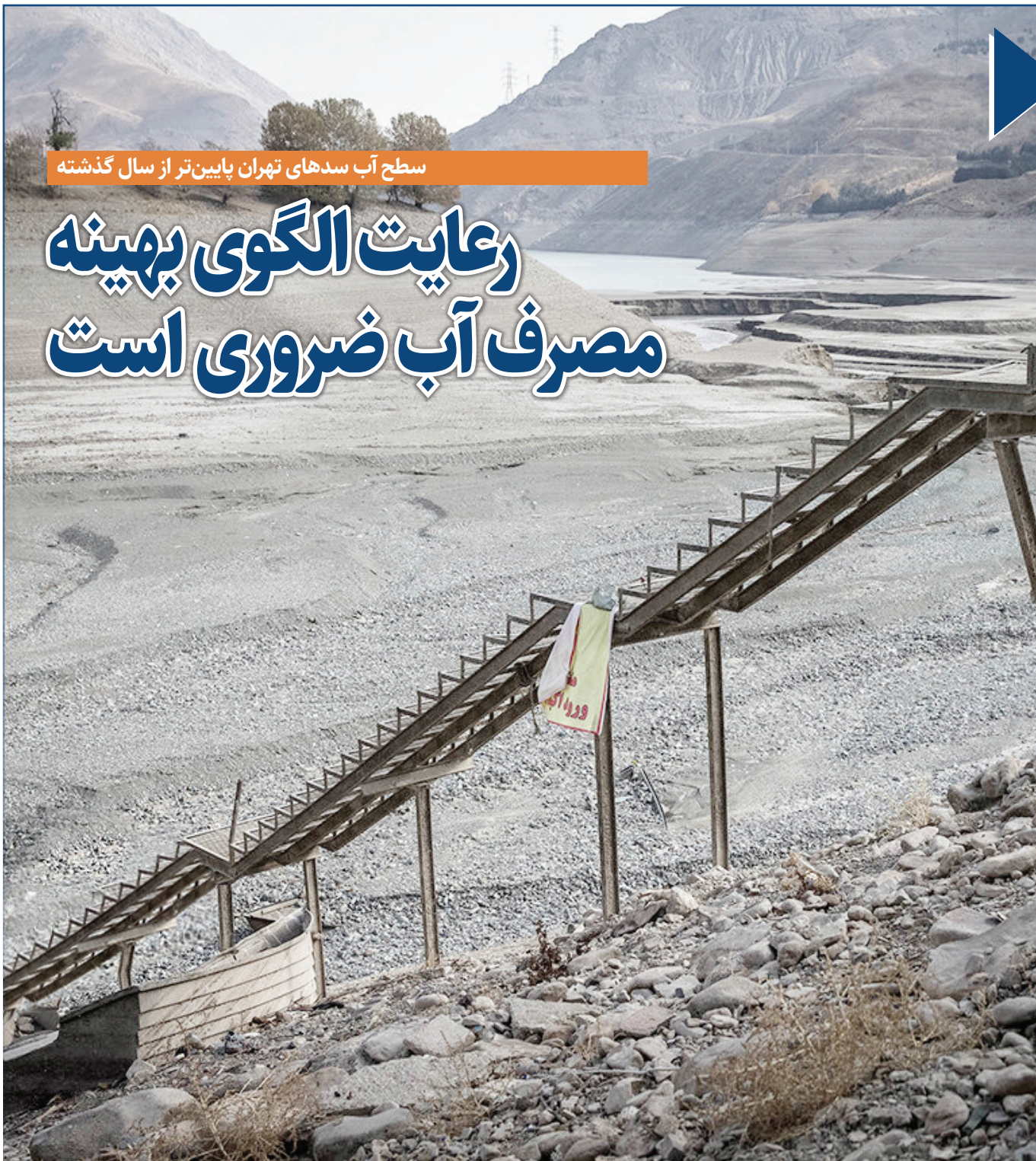
سطح آب سدهای تهران پایین‌تر از سال گذشته