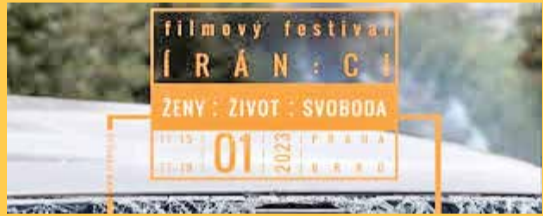
جشنواره فیلم‌های ایرانی در پراگ، چکسلواکی با شعار زن، زندگی، آزادی