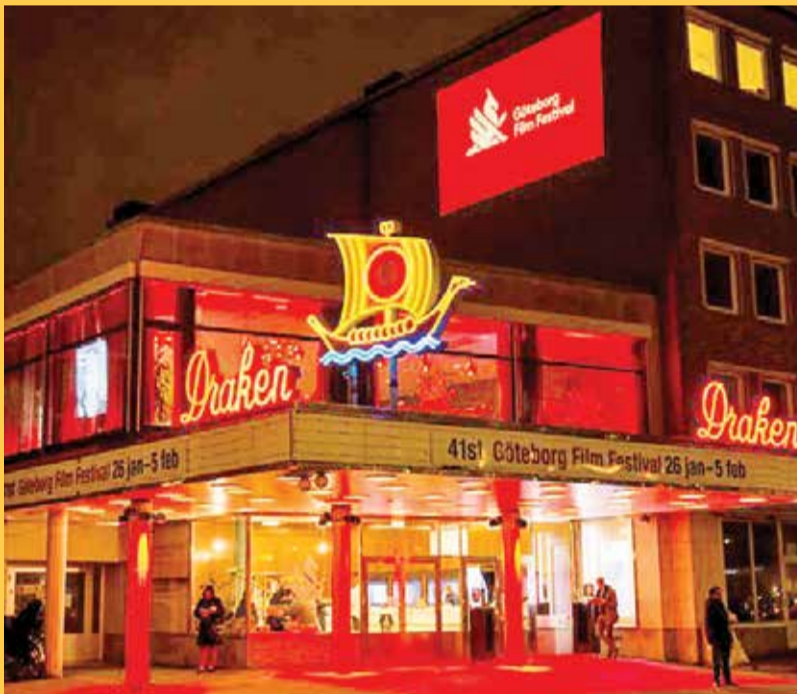
جشنواره گوتنبرگ در سوئد