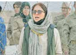
روی خط جشنواره های فجر