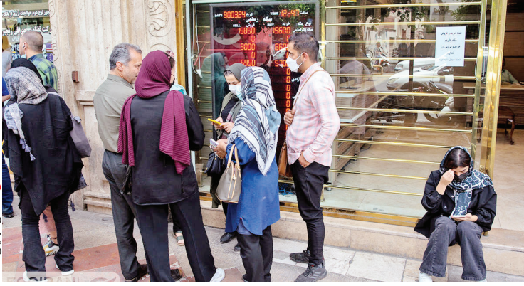
عکس ترافیک است

به فروش منابع تأمین شده از این محل به اشخاص حقیقی ایرانی (بالای ۱۸ سال) و حقوقی مقیم به صورت یک بار در سال برای هر مشتری و پس از احراز هویت وی تا سقف ۵۰۰۰ یورو یا معادل آن به سایر