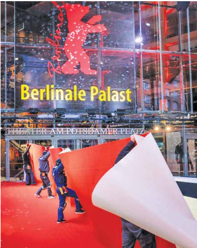
سایت جشنواره برلین

محمدمهدی اسماعیلی در پیام خود آورده است: «راز زنده ماندن و پویایی هنر تئاتر در بازنمایی «زندگی» است. در دایره نگاه اسلام ناب محمدی (ص)، هنر عبارت است از تکمیل و تکامل و تعالی هر آنچه قابلیت تجلی دارد و نزدیک ساختن انسان‌ها به تقوا و خداوند متعال؛ خدایی که «زیبا» است و «زیبایی» را دوست دارد. هنر در این گیتی، دنیا را صاف و روشن می‌کند و «جان» را یاری می‌دهد تا از ثگرت و آشفتنگی‌ها قطع علاقه کند و به سوی وحدت نامتناهی روی آورد. تئاتر مجموعه بیکرانه تصویرها در ترازوی با حرکت پایدار ماده، در جهان همواره دستخوش تغییر و تحول است، چون هستی ایستا و ثابت نیست. ماهیت هستی تئاتر همواره پویاست. جهان تئاتر دنیای تصاویر منجمد و فن و تکنیک متغعل و معامله‌گری و خودنمایی نیست، همیشه.»