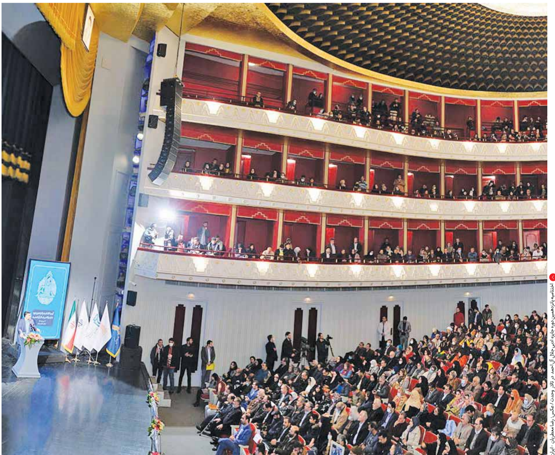
اختتامیه پانزدهمین دوره جایزه ادبی جلال آل احمد در تالار وحدت

پانزدهمین دوره جایزه ادبی جلال آل احمد هم در هفته گذشته در تالار وحدت به کار خود پایان داد. جایزه‌ای که می‌توان آن را حاکمیتی‌ترین کنش ادبی در حوزه کتاب و ادبیات دانست. با این همه اما حالا بعد از پانزده دوره برگزاری ضرورت بازنگری در مورد این جایزه ادبی احساس می‌شود چه آنکه هر رویداد بشری به دلیل آنکه ساخته و پرداخته فکر و ذهن انسان است، لاجرم باید مدام روزآوری شود. طبعاً جایزه ادبی جلال هم از این قاعده مستثنی نیست. اصول