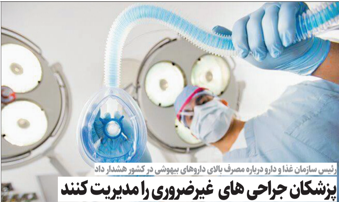
رئیس سازمان غذا و دارو درباره مصرف بالای داروهای بیهوشی در کشور هشدار داد

یون سوک یول در جریان سفر جاری به امارات متحده عربی، دیداری هم با سرپازان کره‌ای مستقر در امارات انجام داد و در حالی که لباس فرم ارتش کره جنوبی را به تن داشت، در حرف‌هایی تنش‌زا و بی‌ربط، خطاب به سرپازان کشورش گفت: «شما اینجا هستید زیرا امارات ملت برادر ما است. و (دفاع از) امنیت ملت برادرمان به اندازه امنیت کره جنوبی مهم است. دشمن و تهدید اصلی برای امارات، ایران است و دشمن ما کره شمالی است... ما در موقعیتی بسیار شبیه به امارات هستیم.»