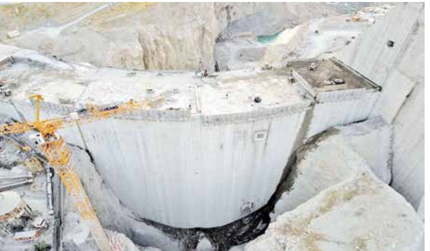
سایت سد چم شیر

رئیس سازمان حفاظت محیط زیست در این نامه با اشاره به ارسال نامه‌ای به معاون آب و آبفای وزارت نیرو با موضوع ابهامات مطرح شده و مطالعات و مستندات تکمیلی جهت منابع شوری در مخزن، دریاچه سد و احتمال شوری آب، به دغدغه