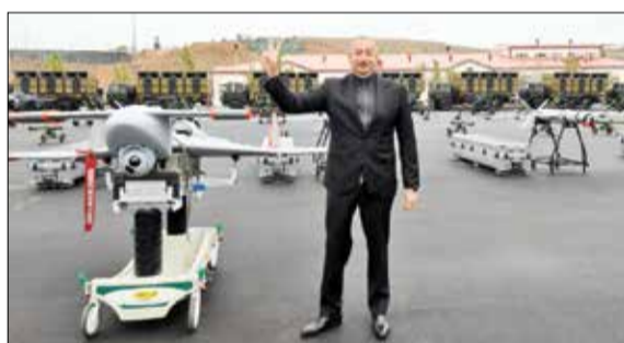
علی اف، رئیس جمهور آذربایجان در کنار یک هواپیمای بدون سرنشین مهمات سرگردان هاروپ ساخت اسرائیل در اکتبر ۲۰۲۱

محدود باقی خواهد ماند و همین نکته به خوبی نشان‌دهنده حساسیت ایران روی منطقه «زنگزور» به عنوان نکته کلیدی این دعوای راهبردی است.