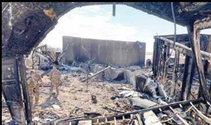
ایران اصلی ترین کشوری است که در مقابل سلطه جویی آمریکا در جهان قد علم کرده است