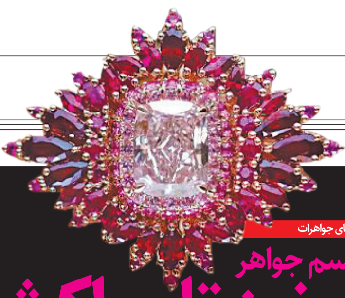
سفر به دنیای جواهرات