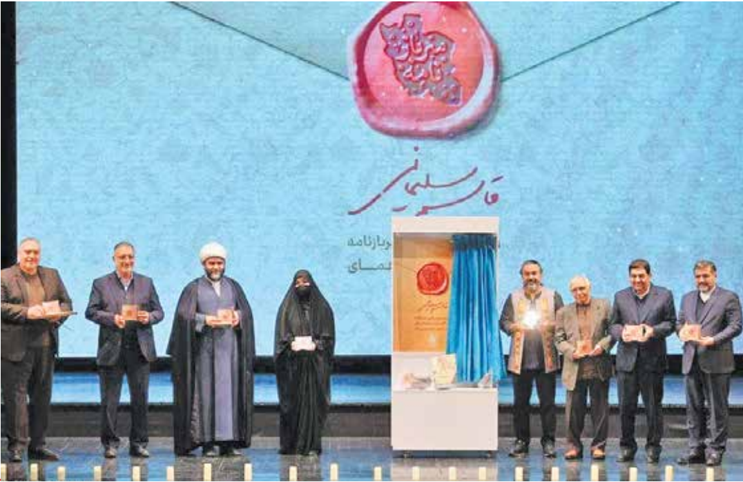
سایت وزارت فرهنگ و ارشاد اسلامی

در بخشی از پیش‌گفتار این کتاب به قلم ناشر آمده: «سربازنامه منظومه‌ای است حماسی، ملی و آیینی. تلفیقی از اسلوب متون منظوم فارسی پیرامون افسانه‌ها و اساطیر باستان و آموزه‌های دینی و انقلابی امروز ایران زمین، با این تفاوت که روایت این منظومه، نه بازگویم افسانه‌های دوردست و کهن است و نه قهرمان آن اسطوره‌ای خیالی. داستان سربازنامه، صرف‌نظر از آرایه‌ها و استعاره‌های