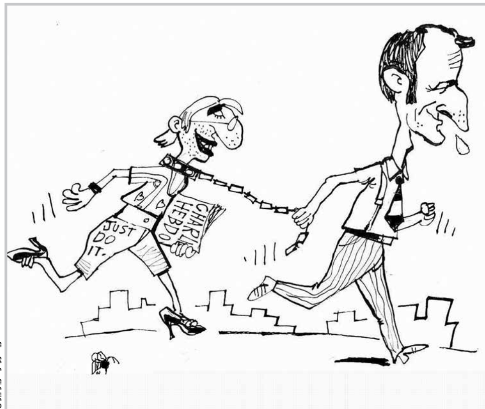
کاریکاتور از مازیار بیژنی