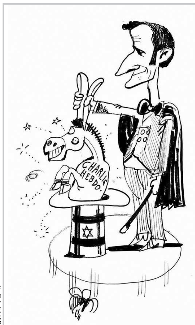
کاریکاتور از مازیار بیژنی