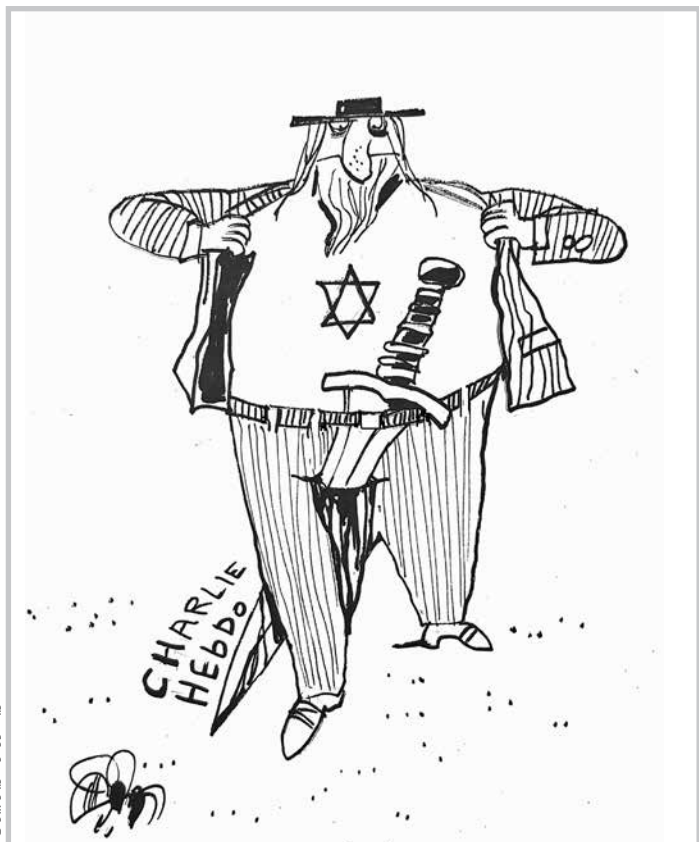
کاریکاتور از مازیار بیژنی