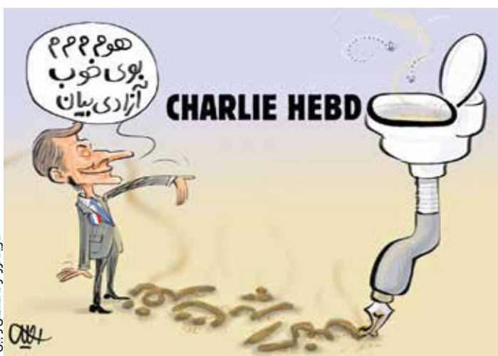
کاریکاتور از محمدعلی رجبی