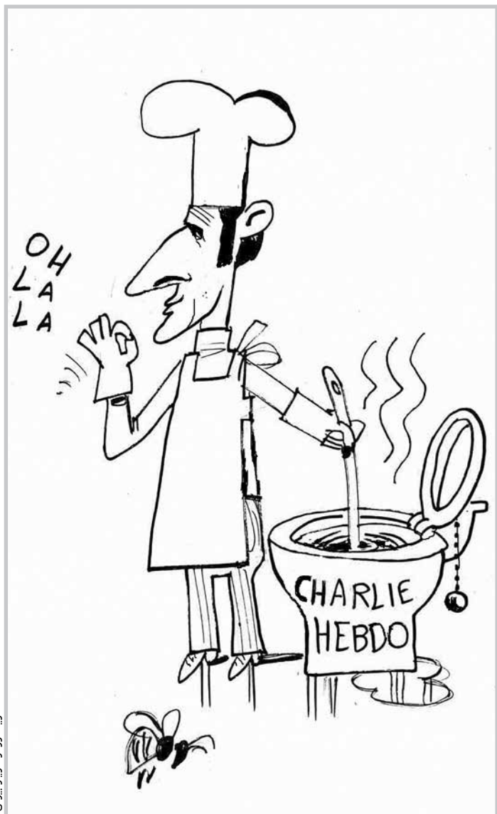
کاریکاتور از مازیار بیژنی