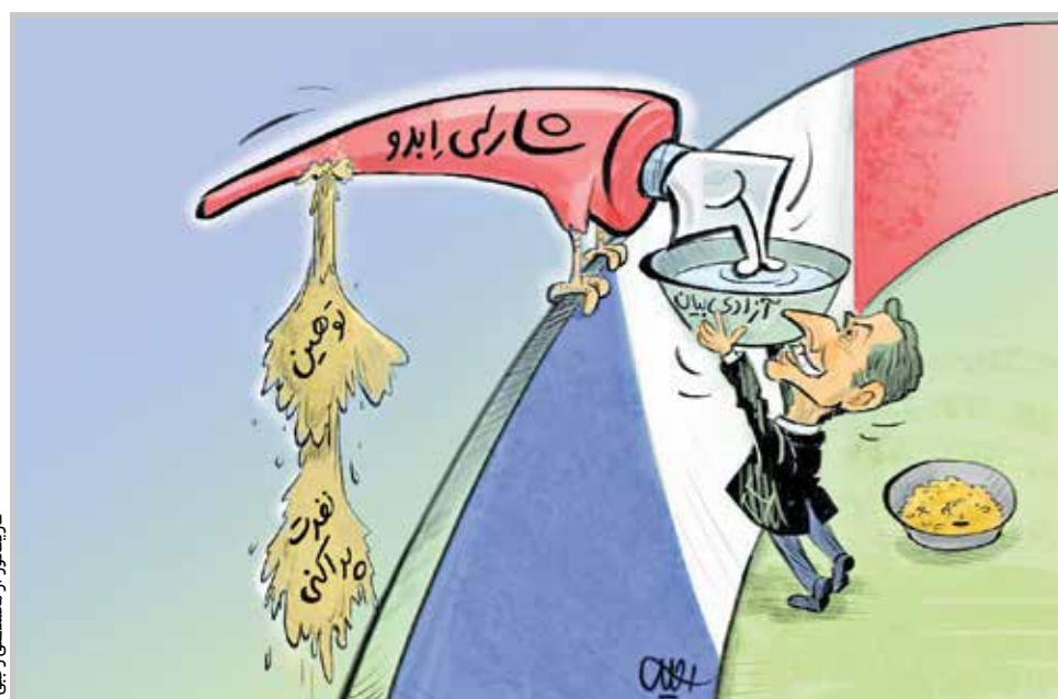
کاریکاتور از محمدعلی رجبی