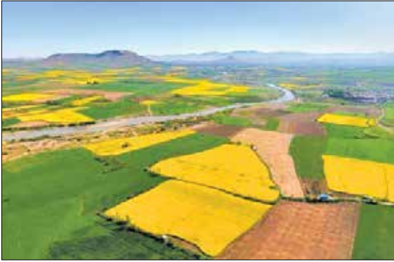
نقیسه امامی خبرنگار

در دولت سیزدهم میزان سنددار شدن اراضی کشاورزی با رشدی ۳۰۰ درصدی به ۲ میلیون و ۸۶۰ هزار هکتار رسیده است