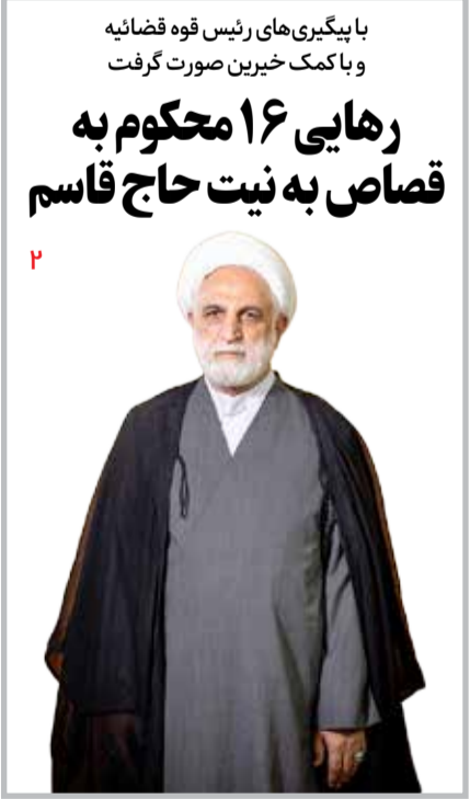
با پیگیری‌های رئیس قوه قضائیه و با کمک خیرین صورت گرفت