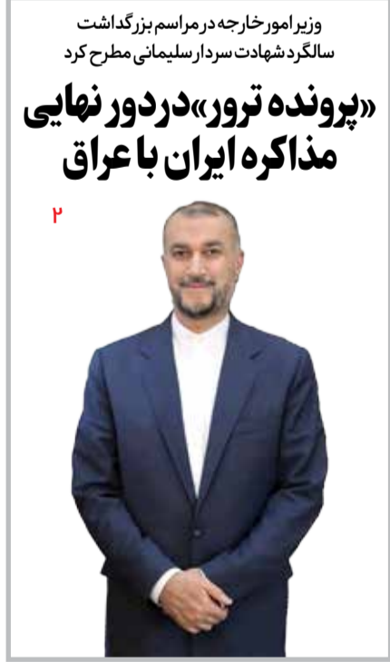
وزیر امور خارجه در مراسم بزرگداشت سالگرد شهادت سردار سلیمانی مطرح کرد